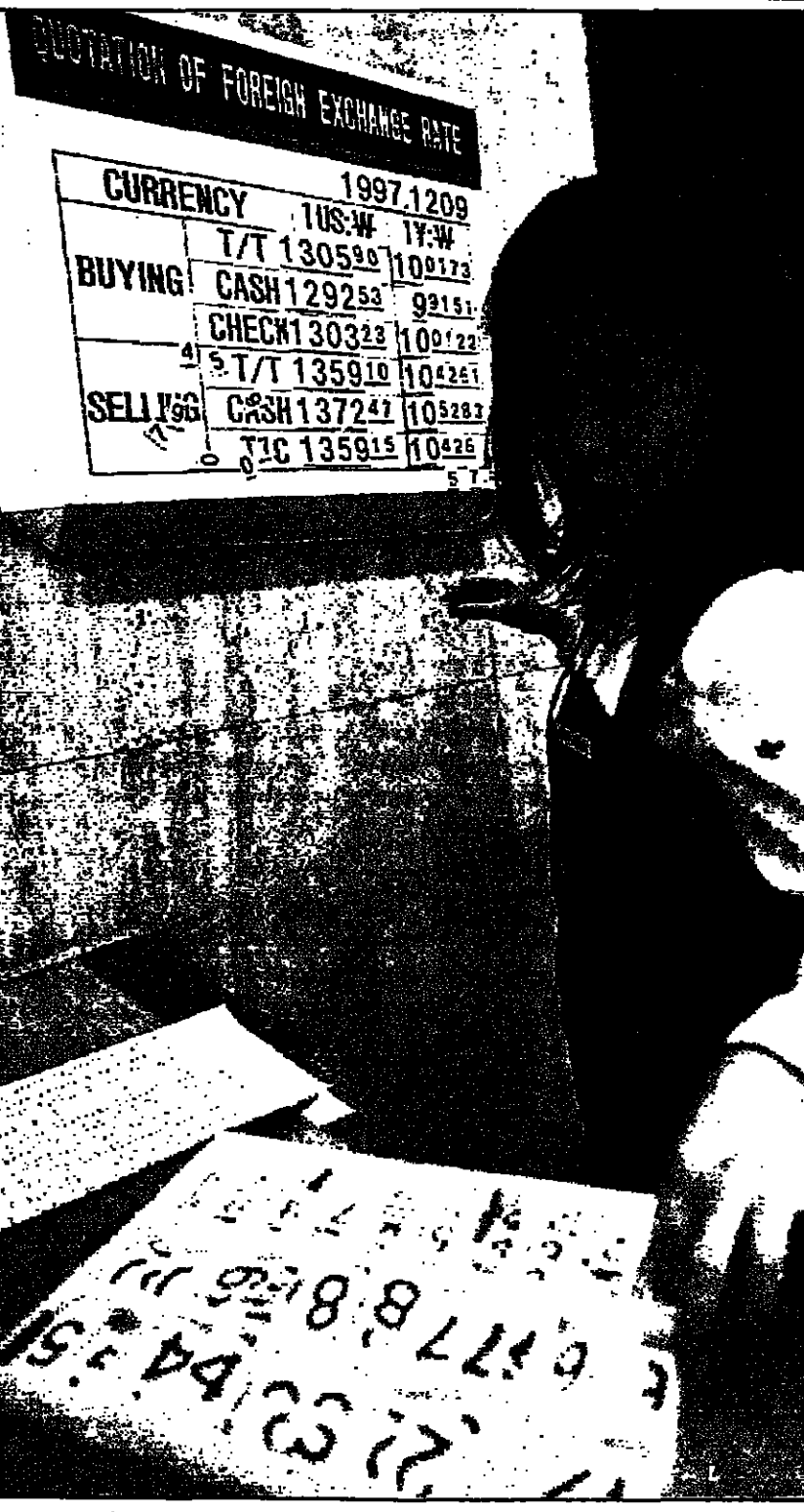
مستخدمة في بنك في العاصمة الكورية الجنوبية سول تحمل اسم اسعار صرف العملة الوطنية (رويوت)